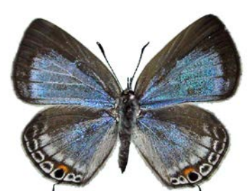
Nov.21,2008 加古川市志方町産羽化♀