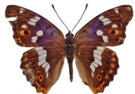
June 26, 1972 宮崎高千穂町河内

面のいたるところで紫幻色を輝かせながらおびたしい数で集団吸水する光景を見ました。キタキツネのものと思われる獣糞に集まる場面の撮影記録は、濃い紫幻色がうまくキャッチできましたが、両方の羽が紫に輝くように撮影するのは容易ではありません。