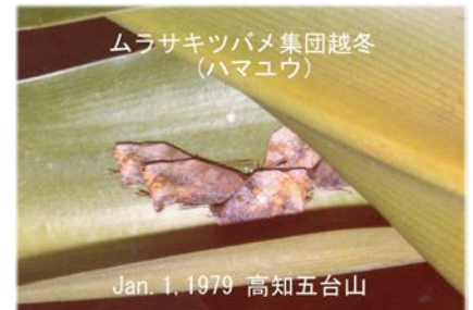
ムラサキツバメ集団越冬 (ハマユウ)