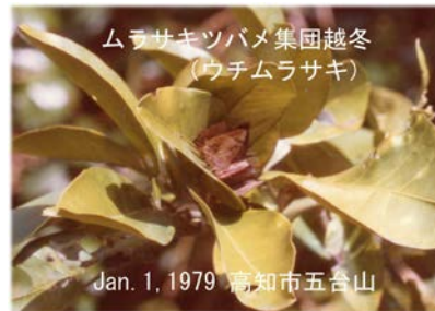
ムラサキツバメ集団越冬 (ウチムラサキ)

さて、その越冬ですが、不思議なことにムラサキツバメは例外なく複数頭が身体を寄せ合うようにした集団越冬をすることで有名です。私の古い記録では、ウチムラサキという葉っぱが大きなミカンの種類で毎年、ほぼ同じ場所で多い場合 20 頭ほどが、身体を少し斜めに傾けた状態でまさに寄り添うようにして冬の寒さをしのいでいる観察例があります。集団の雌雄構成比はほぼ 1 : 1 で、暖冬の暖かい日中にはつい飛び出してきて日向ぼっこを楽しむ個体もみられました。1979 年 1 月にはハマユウの分厚い葉っぱの陰で集団を形成するようすも観察できました。写真でわかるように、前翅を後翅の間にすっぽりとうずめこんで、本当に深い眠りに見えます。冬を成虫で過ごす近縁のムラサキシジミではこのように集団化することはなく、その違いが何なのか良く分かりません。こうした集団越冬はテントウムシやカメムシの仲間でも多く見られる習性で、いったいどのような信号を発し合って集まるのでしょうか。