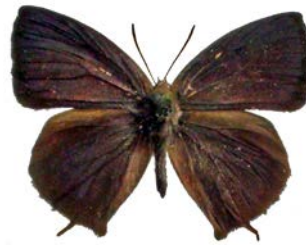
ムラサキツバメ♂ Nov. 29, 2008 和歌山周参見町

ムラサキツバメは幼虫がマテバジイ、シリブカガシというカシの仲間を食べる暖地性のチョウで、近年の地球温暖化のせいと、マテバジイが街路樹として広く植栽される風潮も追い風となって、現在は神奈川県にはほぼ定着し、千葉県から茨城県にまで進出しているもようです。♂はほとんど輝きのないにぶい黒紫色で、♀はきれいな青紫に輝きます。はねの形は、チョウ愛好家が必ず魅了されるゼフィルスという仲間とそっくりで、ゼフィルスがない高知市で育った私は、勝手に南国のゼフィルスと呼んでいました。ゼフィルスの定義には「卵で越冬する」というのがあるようで、成虫で越冬するムラサキツバメはその条件から外れてしまいます。