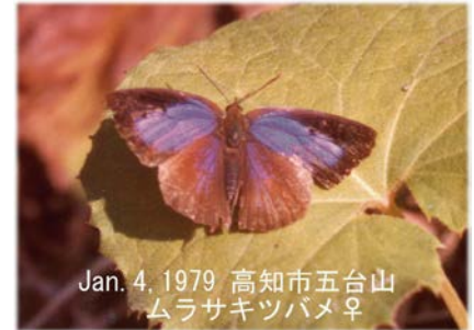
Jan. 4, 1979 高知市五台山 ムラサキツバメ♀

さて、その越冬ですが、不思議なことにムラサキツバメは例外なく複数頭が身体を寄せ合うようにした集団越冬をすることで有名です。私の古い記録では、ウチムラサキという葉っぱが大きなミカンの種類で毎年、ほぼ同じ場所で多い場合 20 頭ほどが、身体を少し斜めに傾けた状態でまさに寄り添うようにして冬の寒さをしのいでいる観察例があります。集団の雌雄構成比はほぼ 1 : 1 で、暖冬の暖かい日中にはつい飛び出してきて日向ぼっこを楽しむ個体もみられました。1979 年 1 月にはハマユウの分厚い葉っぱの陰で集団を形成するようすも観察できました。写真でわかるように、前翅を後翅の間にすっぽりとうずめこんで、本当に深い眠りに見えます。冬を成虫で過ごす近縁のムラサキシジミではこのように集団化することはなく、その違いが何なのか良く分かりません。こうした集団越冬はテントウムシやカメムシの仲間でも多く見られる習性で、いったいどのような信号を発し合って集まるのでしょうか。